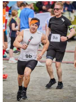
Staffel Stift Melk & Friends