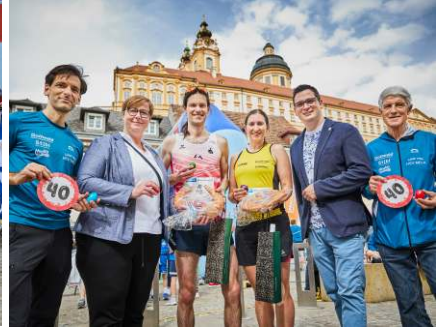
Siegerin und Sieger Hauptlauf