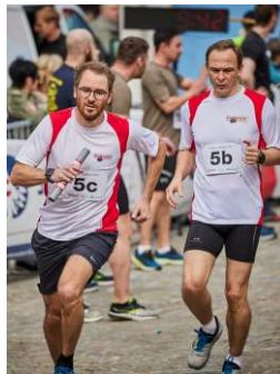
Staffel Gebrüder Gottwald