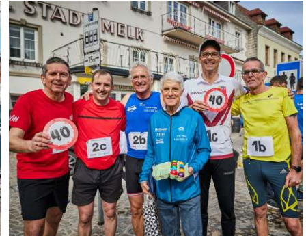
Promistaffel 1 und 2