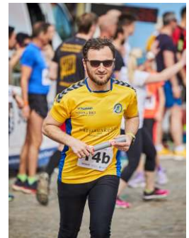
Staffel SC Rathauskeller Melk